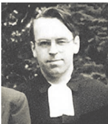
Moltmann yn weinidog ifanc yn Bremen

Flynyddoedd yn ddiweddarach, ac wedi bod am dair blynedd yn weinidog yn Bremen ysgrifennodd, 'Ni chofiaf amser i mi ymrwymo i Grist ('a decision for Christ' yw'r cyfieithiad Saesneg) ond fe wn i sicrwydd mai yn nhywyllwch fy enaid y gwelodd Crist fi.'