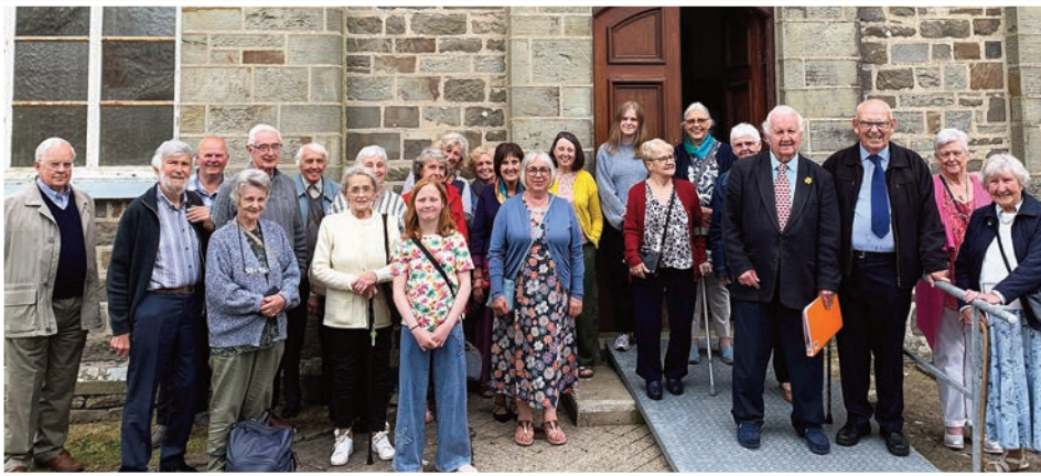
Pererindotwyr yr Allt-wen a Chastell-nedd o flaen porth Capel y Wig